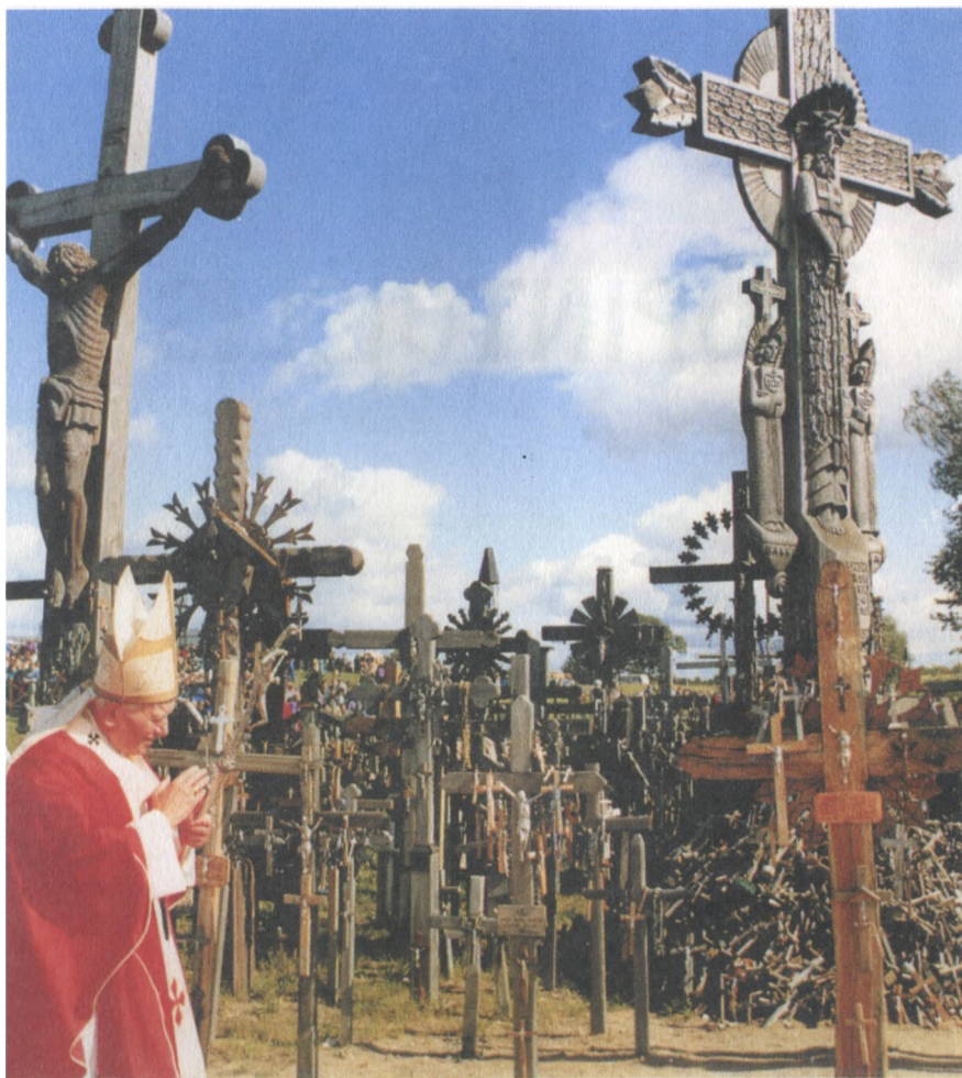
Popiežius Jonas Paulius II Kryži kalne. 1993 m. rugs jis