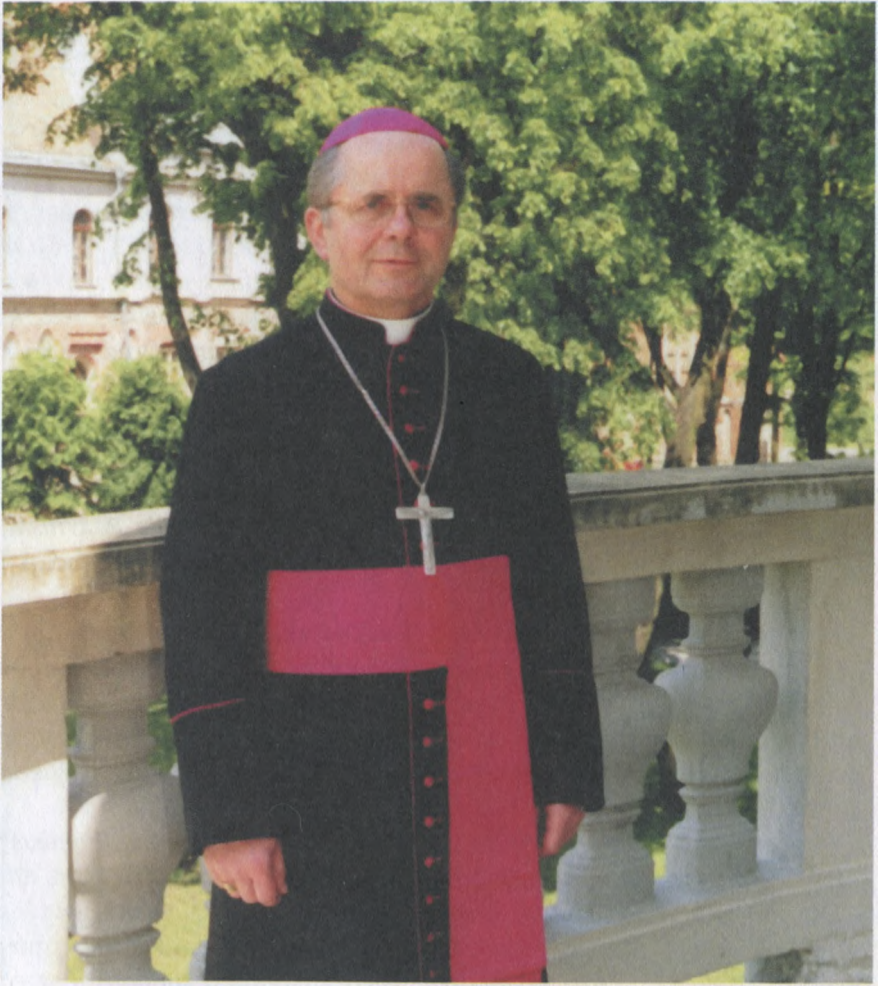
Kauno arkivyskupas metropolitas Sigitas Tamkevičius.