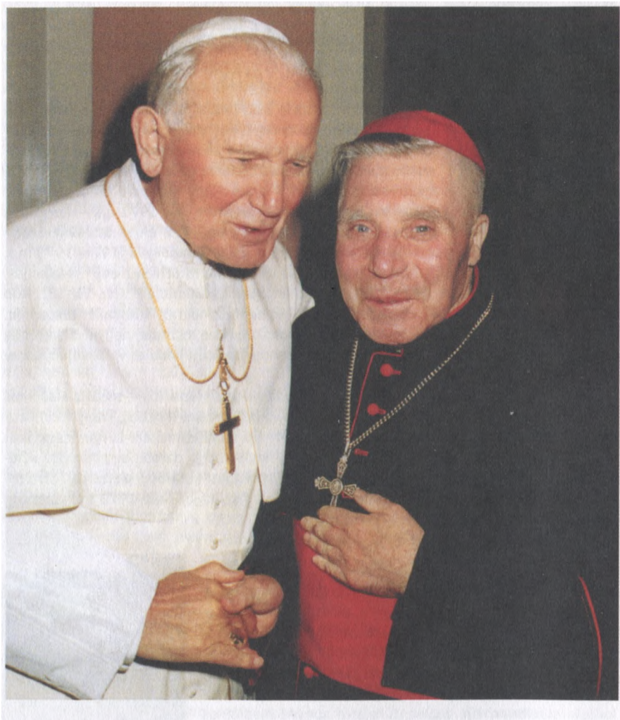
Popiežius Jonas Paulius II ir kardinolas Vincentas Sladkevičius. Kaunas. Arkivyskupo r. mai. 1993 09 06