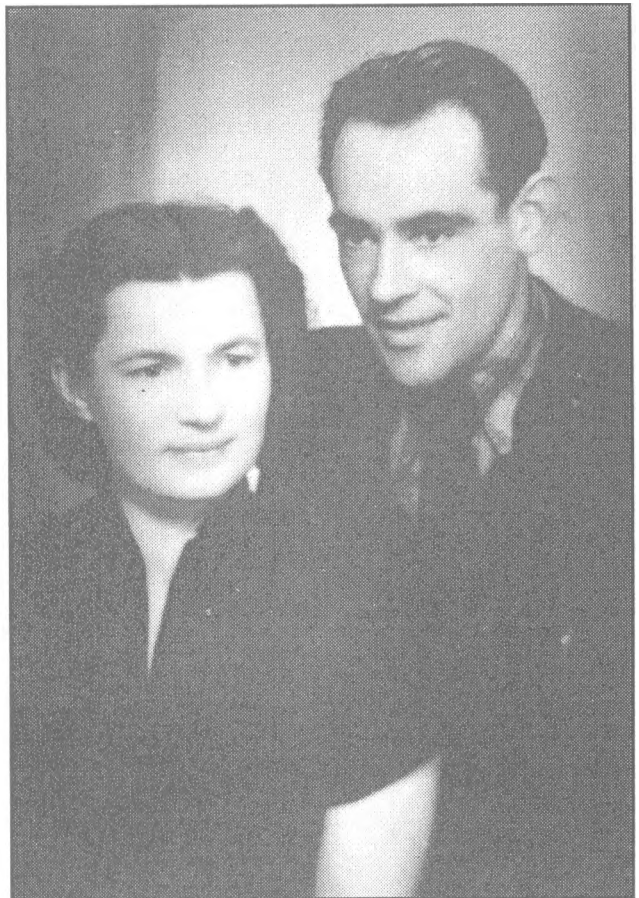
Knygos autorius su žmona Juze Lietuvoje 1957 metais.