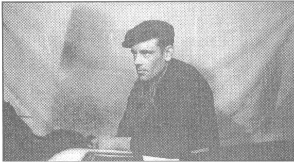
Knygos autorius 1955 metais lageryje.