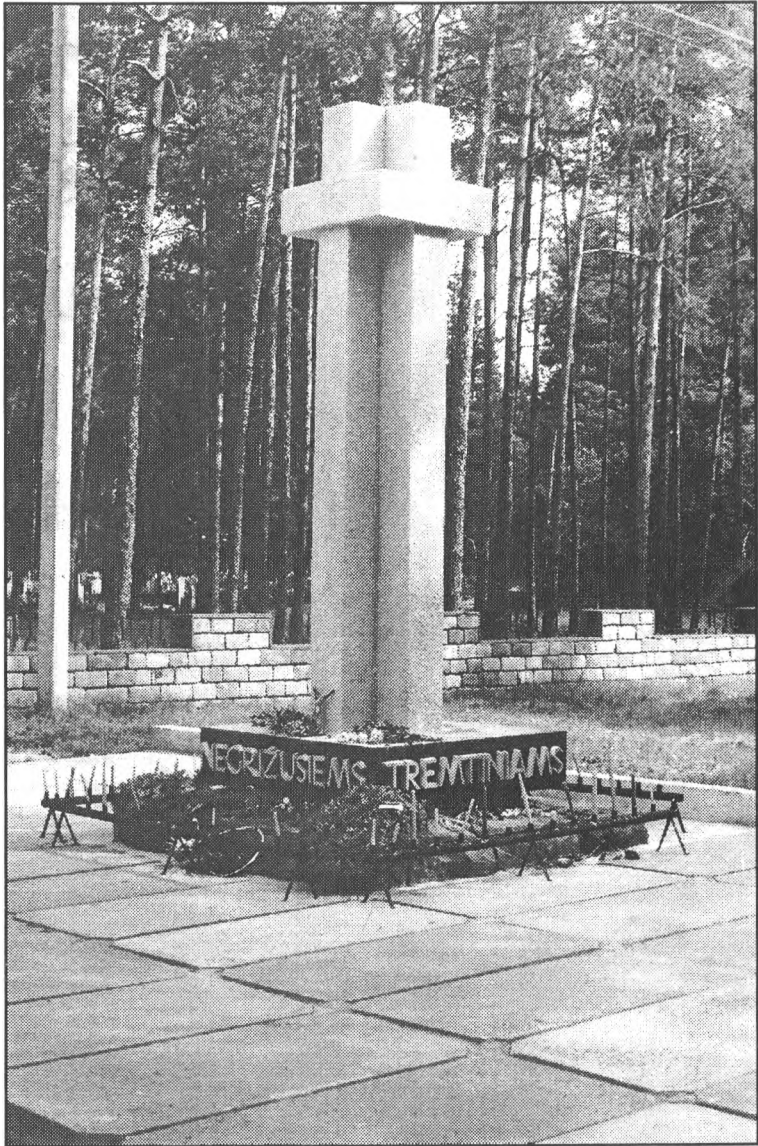
Paminklas negr žusiems tremtiniam ir politiniams kaliniams prie Dukstynos kapinių Ukmergėje