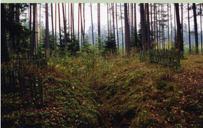
Buvusio Kauno bunkerio vieta. Švenčionių r. sav. Labanoro regioninis parkas, Švenčionėlių miškų urėdija, Antaliedės girininkija, Kiauneliškio miškas, 27 kvart. 10 sklypas. 1999 m.