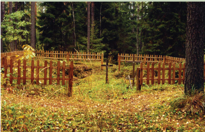
Buvusio Margio bunkerio vieta. Švenčionių r. sav. Labanoro regioninis parkas, Švenčionėlių miškų urėdija, Antaliedės girininkija, Kiauneliškio miškas, 27 kvart. 6 sklypas. 1999 m.