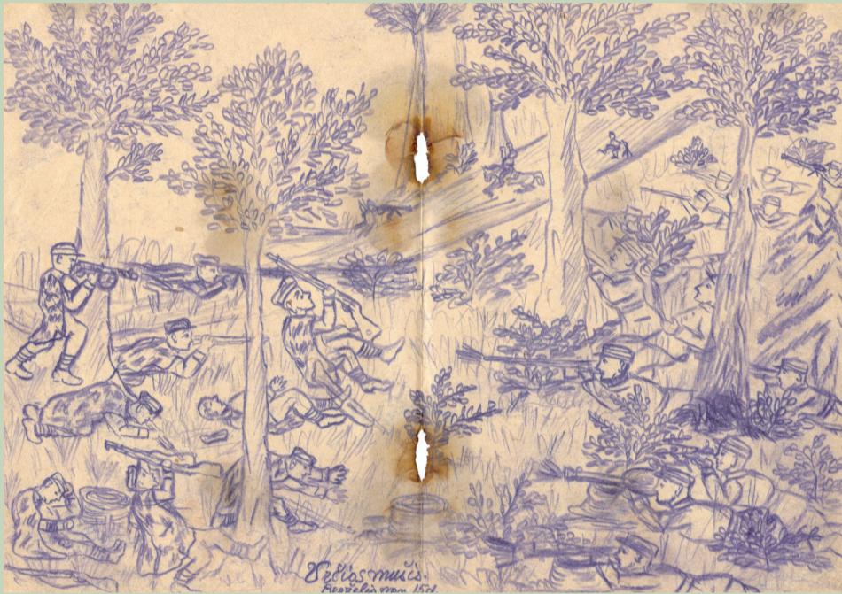
Nežinomo partizano pieštas piešinys „Varčios mūšis“.

Pietų Lietuvos partizanų sritis, Atlasas, Vilnius: LGGRTC, 2008, l. 20-21.