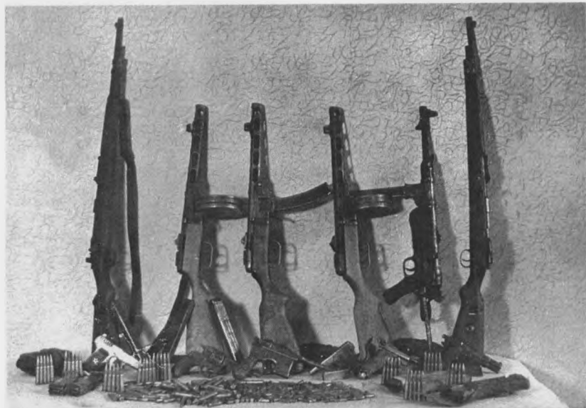
Polekniškių kaime 1951 11 23 suimtų Laisvės būrio partizanų ginklai Valstybės saugumo ministerijoje