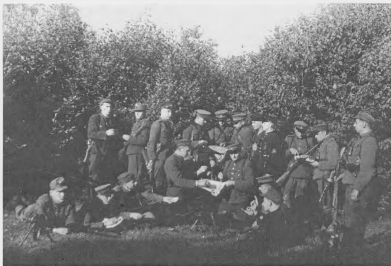
Lokio rinktinės Erškėčio kuopos ir Liūto rinktinės Laisvės būrio partizanai Minčios girioje (1948 m. birželio mėn.)