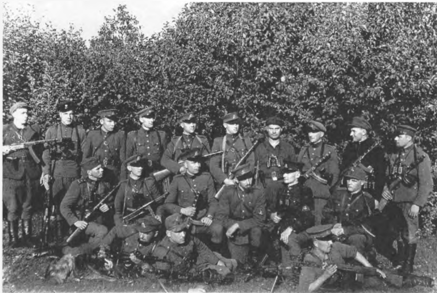
Lokio rinktinės Erškėčio kuopos ir Liūto rinktinės Laisvės būrio partizanai Minčios girioje (1948 m. birželio mėn.)