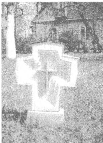
Saldutiškyje 1997 m. pastatytas paminklas Laisvės kovotojams.

Du jauni idealistai - lietuvininkai nuo Baltijos jūros - paguldė galvas už Lietuvą, o Kalnų srities partizanų vadas, MGB smogikas " Ramojus " dabar vaikšto po Vilnių, galbūt naudojasi karo dalyvio pensija (ir vertas: saugumui dirbo iki pat nepriklausomybės paskelbimo). " Lokio " rinktinės įgaliotinis ryšių reikalams " Kiaunės" rajono viršininkas, buvęs MGB smogikas " Bimba " tapo kunigu ir darbuojasi Baltarusijoje, Mosaro bažnytkaimyje ".