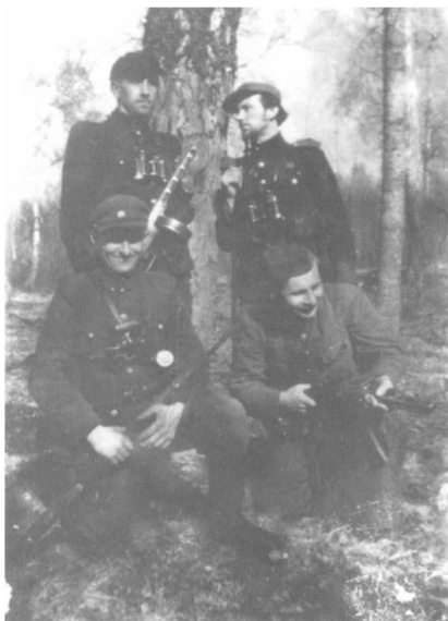
41. „Vyčio“ apygardos Krekenavos apylinkių partizanai.