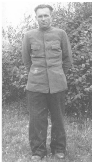
42. „Kuprio“ būrio partizanas.