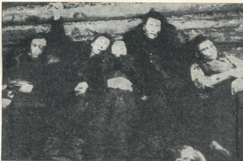
Nežinomi Tauro apygardos partizanai