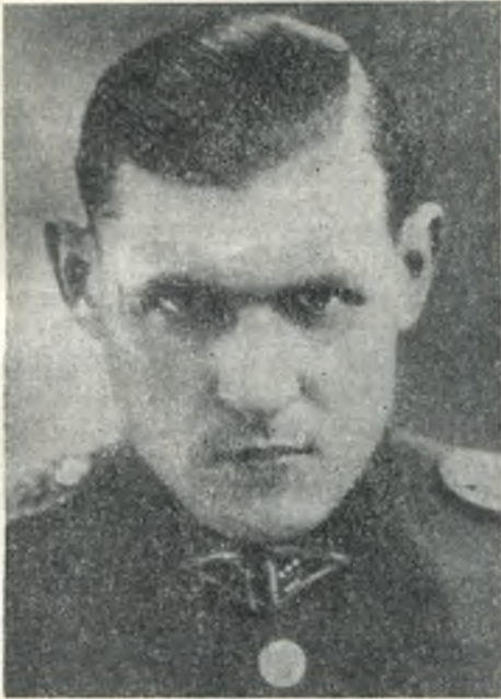
J. Žemaitis-Vytautas — LLKS Prezidiumo Pirmininkas