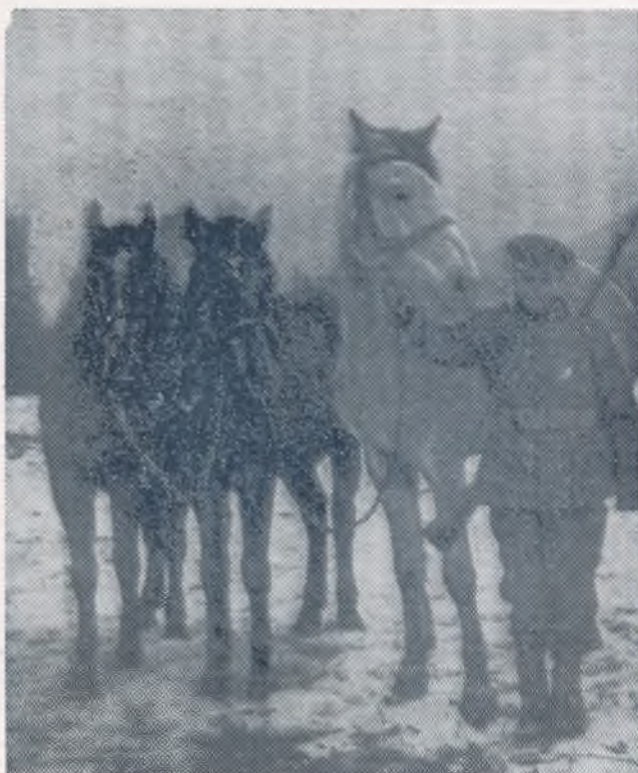
13 metų šaulys su karo grobiu, paimtais lenkų arkliais, 1920 m.

Šaulių S-ga Lietuvoje buvo karinė organizacija, todėl pirmoje eilėje rūpinosi apsiginklavimu ir kariniu paruošimu. Krašto Aps. ministerija skyrė S-gai karininkus instruktorius, bei va-