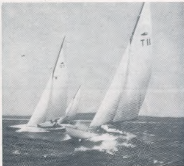
Klaipėdos šaulių jūros klubo, jūros skautų ir Jacht klubo jaunimas dalyvauja regatoje Kuršių maršose nepriklausomybės laikais.

Tad, šauliai, kurie dar kiek pavaldome plunksną, rašykime laisvos Lietuvos gyvenimo