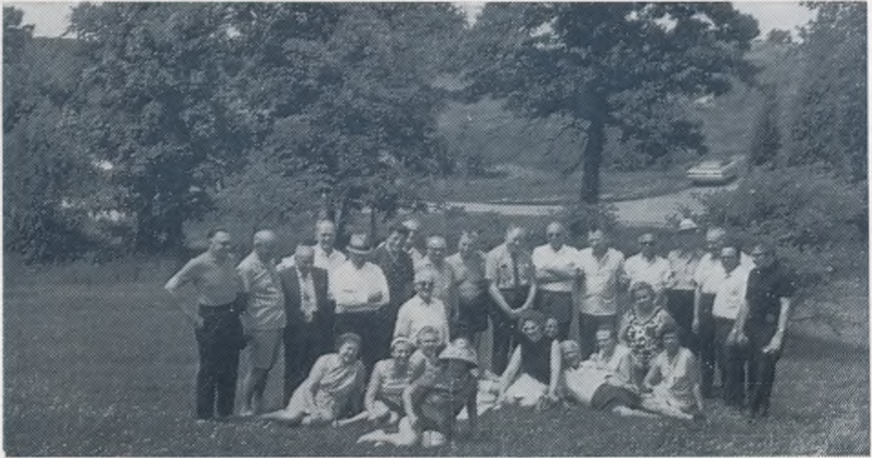
Dūrelis šaulių su lankytojais — Dainavoje