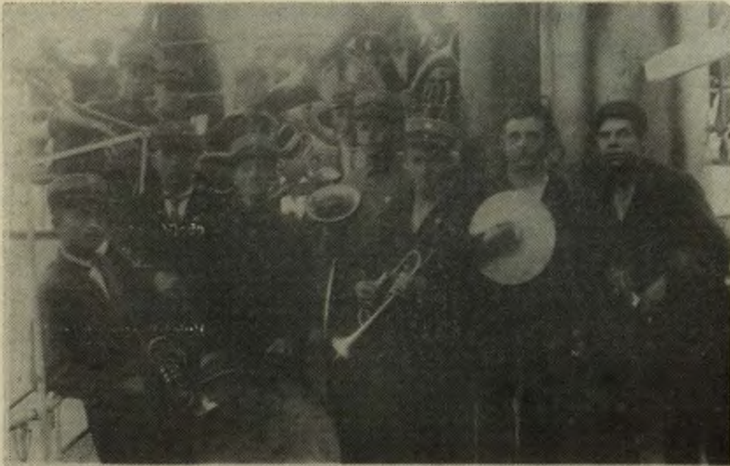
L.Š.S. I Rinktinės šakių šaulių orkestras ant garlaivio "Balanda" Kuršių mariose, prie Klaipėdos, palydi ekskursiją į Žemės Ūkio ir Pramonės parodą Klaipėdoje, 1927 m. rugpjūčio 11 d. (Iš Kosto Vaivados, Čikagoje, albumo)

dentu. Daugiausiai rašiau Kariui ir Trimitui . Reikalui esant rašydavau Lietuvos Aidui ir Rytui , tapusiam XX Amžiumi .