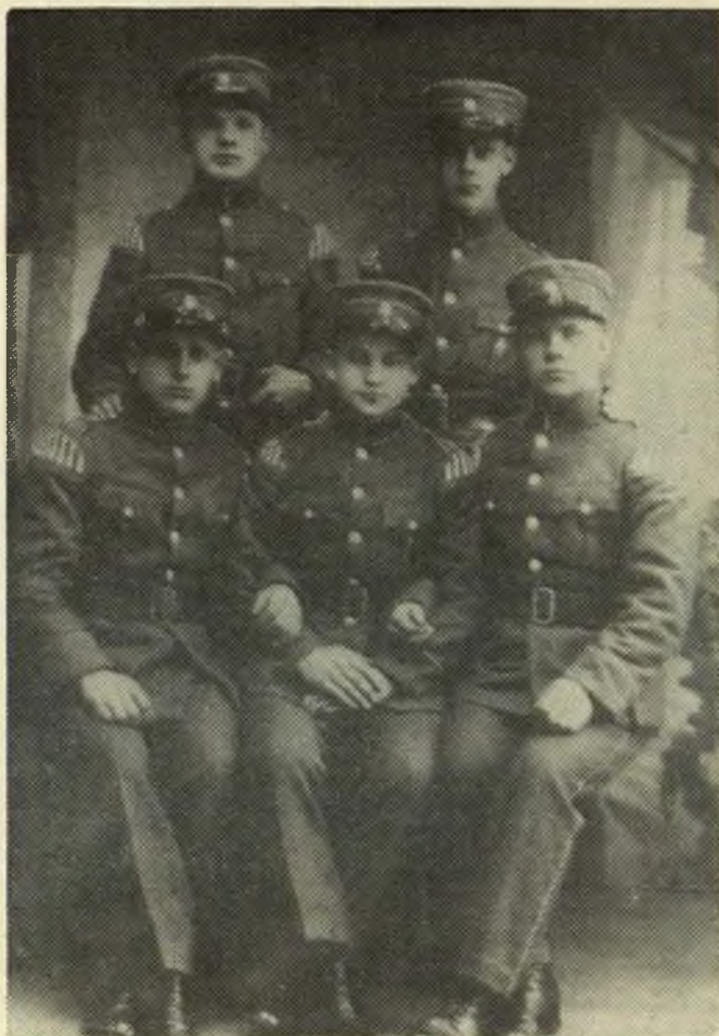
Šakių šauliai orkestrantai, įsigiję naująją šaulių uniformą 1928 m.