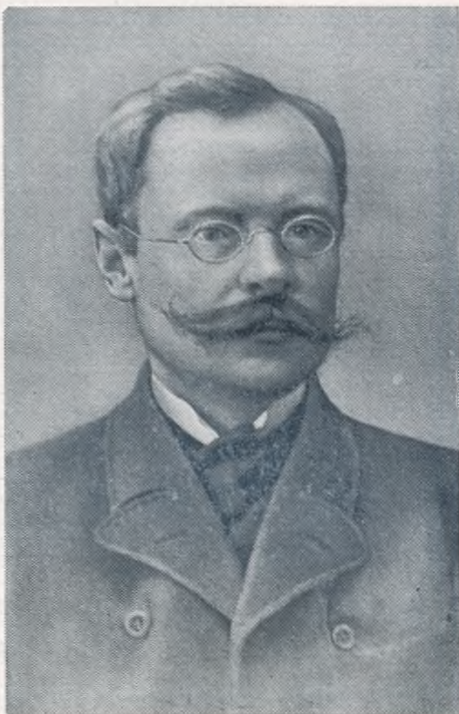
Vladas Putvinskis 1920 metais

Į varpininkus reikia priskaityti Vl. Putvinskis ta prasme, kad jis "Varpo" metu yra atgimęs ir jo srovės smarkiai pagautas. Jam atgimti nebuvo lengva, kadangi buvo lenkiškoje aplinkumoje auklėtas. Kaip daugumas žemaičių bajorų dvarininkų, taip ir Putvinskių šeima laikė save gente lituani, natione poloni — lietuvių kilmės, bet lenkų tautos ar bent lenkų kultūros žmonėmis. Kokia gi iš tokios sąvokos išvada ejo jaunam žmogui, kaip Vl. Putvinskis, norinčiam dirbti visuomenei? Arba eiti ta pačia vaga, kuria ejo kiti sulenkėję dvarininkai, arba atsiskirti nuo jų ir pritaipiti į "litvomaniją", į lietuvių atgimstančiąją srovę. Sunku ryžtis! Juk dvarininkai iš viso