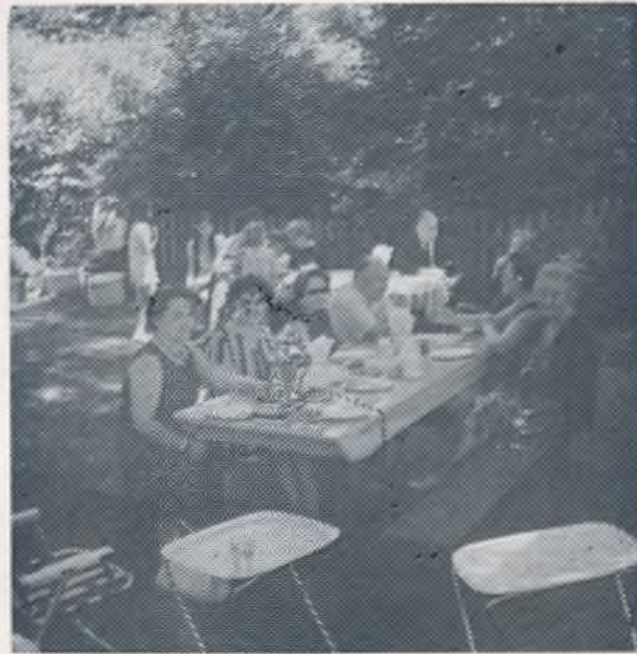
Bostoniečių stalas Joninių iškyloje