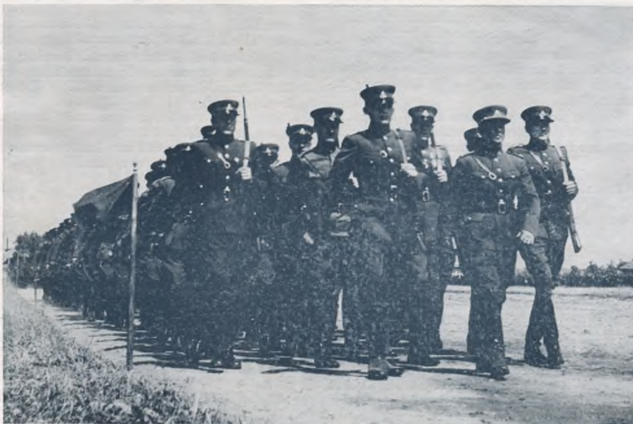
Šaulių dalinys parade

Tuomet dar smilko Lietuvos sodžiuose, miestuose ir miesteliuose I Pas. karo nuodėguliai. Ugnies liepsnos rijo mūsų sodžius ir miestelius. Tačiau nebuvo laiko laukti, kol ateis geresni laikai,