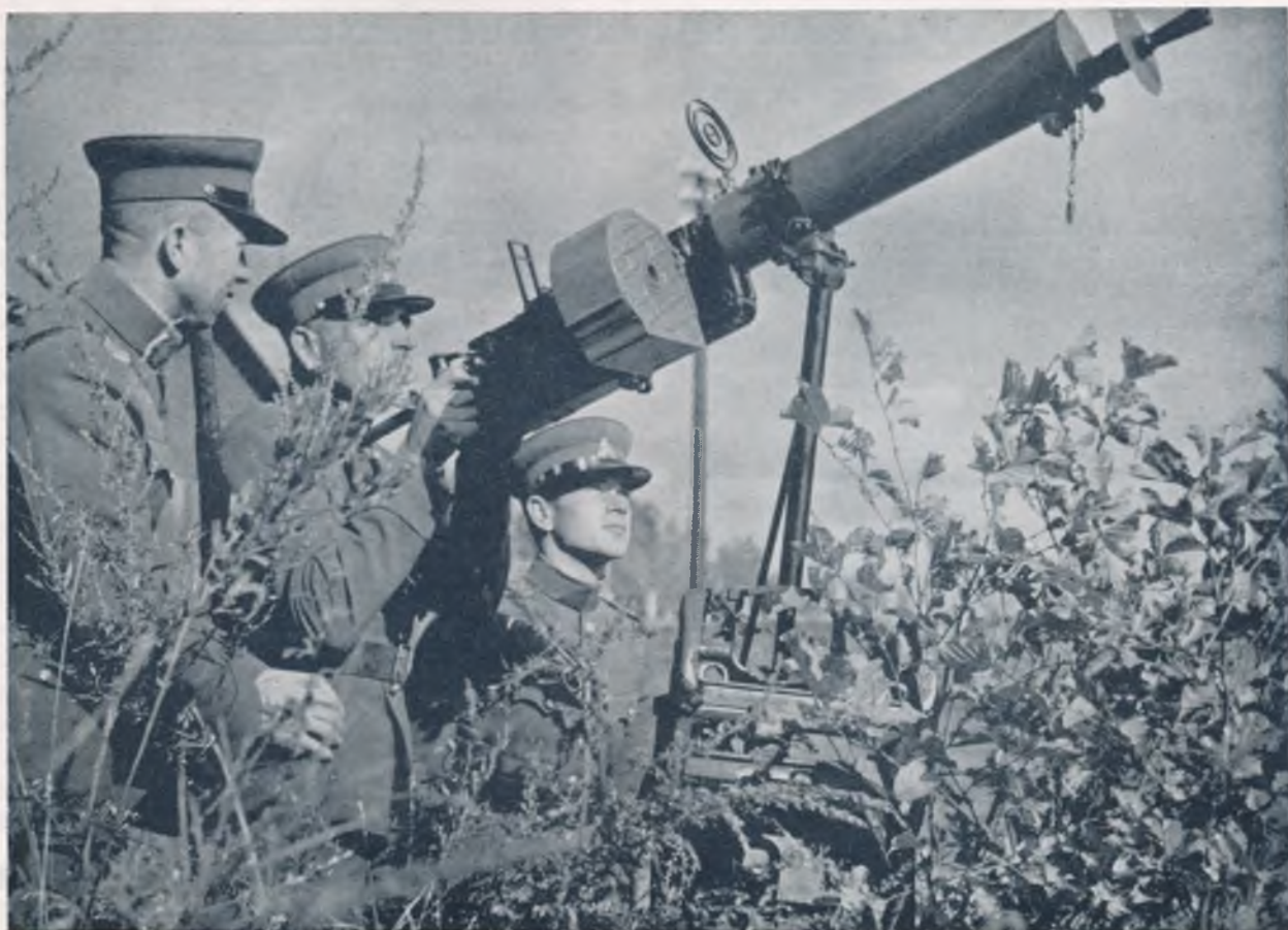
Priešlėktuvinės gynybos pratimai

roito, Mich. apie 62 mylias), įvyko IV-tasis Šaulių Sąjungos suvažiavimas, kuris buvo pavadintas LŠST Kultūrine savaitė . Be pėstininkų šaulių, kad patraukti jaunimą, buvo įsteigtos kelios jūros šaulių kuopos: Čikagoje, Detroite. Ypač gyvo ir sėkmingo pritarimo bei atgarsio rado jaunimo širdyse steigiamos sporto sekcijos (daugiausia sportinį šaudymą praktikuojant, ruošiant taškų sistema pagrįstas varžybas). Organizuojamos taip pat šaudymo varžybos tarp JAV ir Kanados šaulių. Reikia dėliauti, kad Šaulių Sąjunga auga ir svetimoje žemėje. Vis daugiau ateina jaunimo.