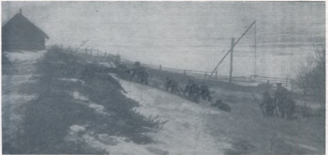
Šaulių būrys lenkų fronte — 1920 m.

Laikraštyje „Lietuva“ pranešama, kad prie Sporto Sąjungos susidarė Šaulių skyrius, kuris liepos 2 d., lygiai 5 val. susirinks Vytauto kalne galutinai savo reikalo aptarti ir padaryti praktikos žingsnių. Liepos 2 d. teatėjo 10 vyrų, bet liepos 8 d. jau 40 vyrų. Tą dieną dalyvavo ir Vladas Putvinskis. Liepos 9 d. jis rašo žmonai: „... sudarėme pradžia Lietuvos Šaulių Sąjungos. Tai pusiau sportinė, pusiau politiniai-kariniai partizaninė organizacija.“