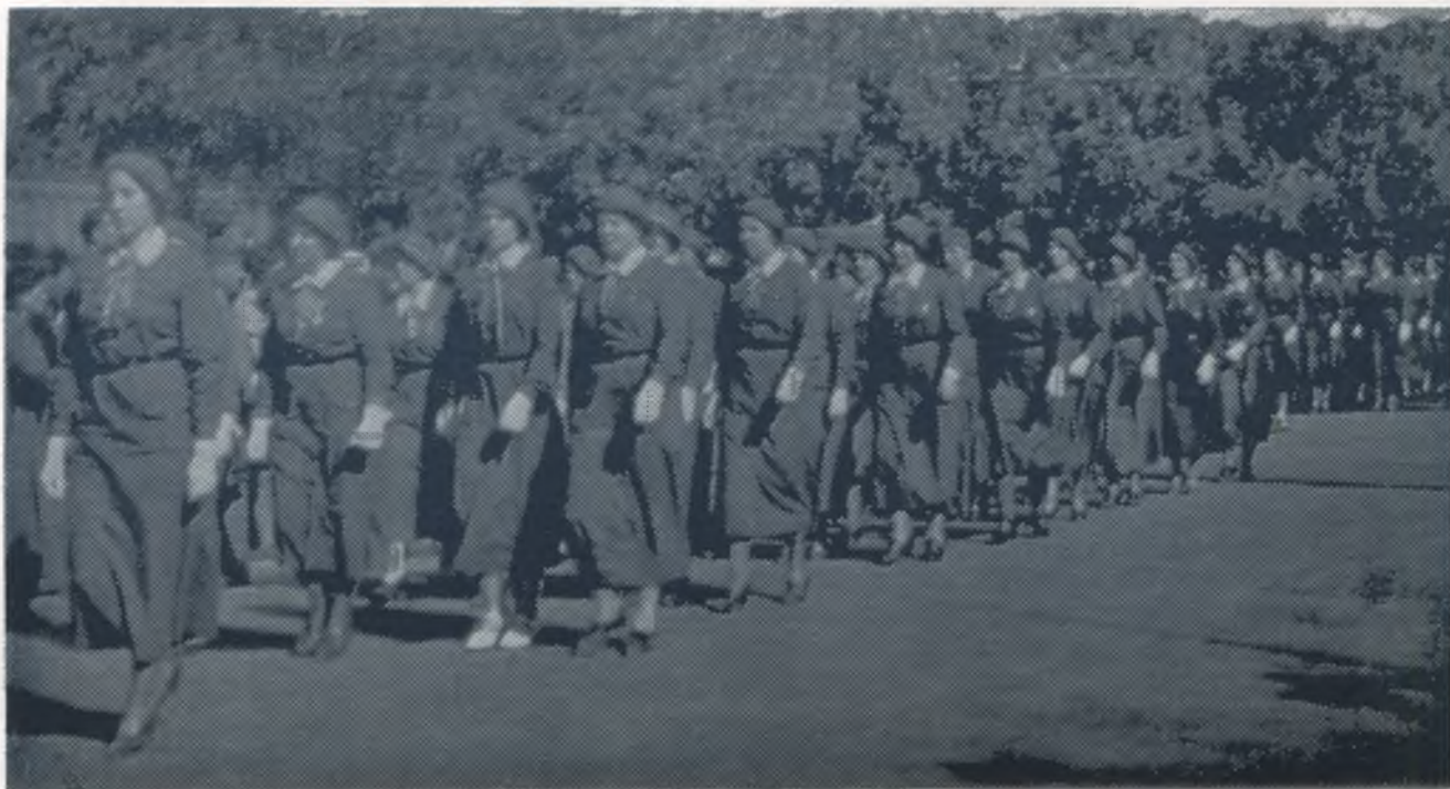
Lietuvos šaulės būrių rikiuotėje