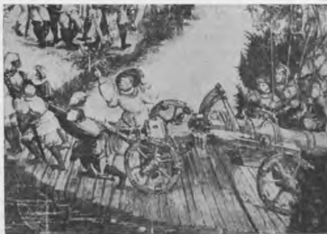
Iš minėto nežinomo autoriaus paveikslo: per tiltą velkama „puška“ su įmantriais taikymo prietaisais.

← žymaus specialisto detalizuoti tų laikų kariuomenės vaizdai: a) Sunkioji samdytoji raitija — t.y. kopijnikai, b) pėstija, c) lengvoji raitis (jų tarpe keli serbai, arba racai, vėliau virtę huzarais), d) artilerija.