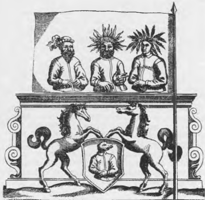
Vaidevučio vėliava. Iš XVII a. graviūros

Karo žygiui pasisėkus, grįžę su grobiu ir belaisviais namo, prūsai paaukodavo dievams pirmą kovoje paimtą gyvą priešą didiką ar vadą. Jie uždėdavo jam visus jo šarvus ir ginklus, pasodindavo ant jo paties žirgo, ar kito toje pat