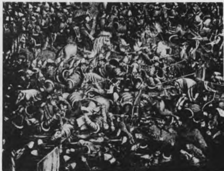
Detalė iš paveikslu Oršos Mūšis

“Omnis Russia ad Letvinos deberet simpliciter pertinere” (visa Rusija turi priklausyti Lietuvai) — ir tęsė tėvų bei protėvių pradėtą darbą, jungdamas prie Lietuvos rusų žemes. Vytautas Didysis didelę savo siekimų dalį skyrė Algirdo politikai įvykdyti, visai stengdamasis nugalėti likusias dar nepriklausomas rusų kunigaikštystes — Tvėrę ir Maskvą. Jo laikais Lietuvos persvara buvo neabejotina. Tačiau per ilgą, pusę šimto metų trukusį Kazimiero Jogailaičio viešpatavimą (1440—1492 m.) situacija pasikeitė. Maskva užaugo, sustiprėjo, o Lietuva, valdovui rūpinantis daugiau Vakarų problemomis, nepastebėjo Rytų priešų kylančios galybės, nesudavė jam laiku reikalingo smūgio. Negabaus ir nerūpestingo jo sūnaus Aleksandro valdymo metu išūlusis maskviškis Ivanas III jau Lietuvą puola ir ši atsiduria gynimosi pozicijoje. Jau maskvėnai ima galvas kelti ir garsiai reikalauti savo kunigaikščiui pripažinti caro titulą.