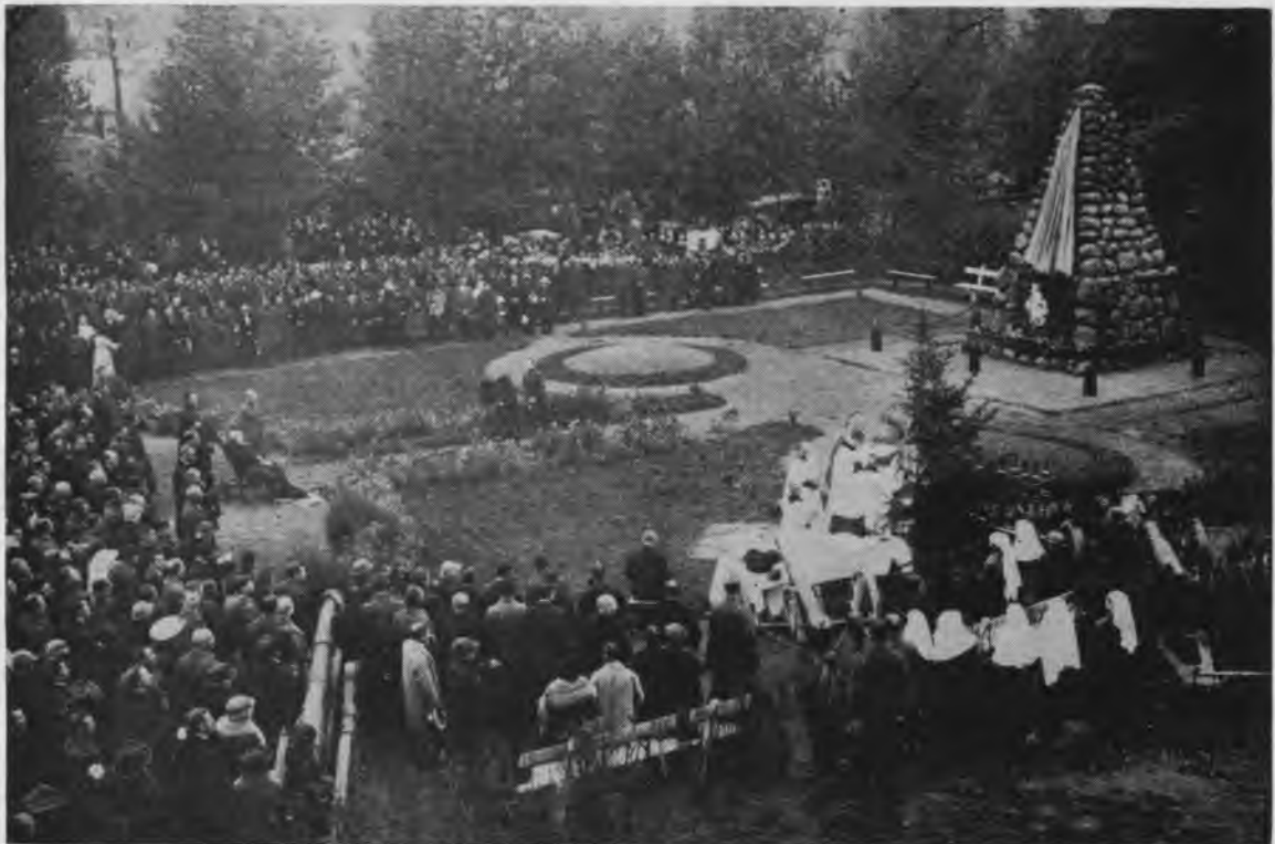
Iškilmės Karo Muzėjaus aikštėje, prie Nežinomojo Kareivio Kapo, 1920 metais

Vieną vasaros sekmadienį irgi pasklido gandas, kad šiandien kažkas uždegs visą miestelį. Diena bu-vo šilta ir labai graži. Iš namų nevisi žmonės išėjo į bažnyčią sumai. Kiti pasiliko budėti namuose. Vidu-je neįauku, taigi išėjo lauk ir rūtų darželiuose susė-dę ant suoliukų meldėsi. Miestelyje labai ramu ir niekas gatvėje nevaikščiojo. Tėvukas išėjo į bažnyčią, o namuose liko mamytė su vaikais. Tupime rūtų darželyje (mamytė pasižymėjo miestelyje savo dar-želio gražumu) ir meldžiamės. Žiūrime, ateina nuo Šiaulių pusės kažkoks vidutinio amžiaus intelligen-tiškas žmogus, mūsų apylinkėje visai nematytas. Rankose nešasi nedidelį lagaminuką. Gatvėje ramu, o prie namų nemaža tyliai besimeldžiančiųjų. Net vaikai ramūs ir susikaupę. Mes bailiai į praeivį žvilgčiojome ir galvojome: ar tik ne šis ateina mūsų miestelį padegti. Tur būt, šioj dėžutėj rankose ne-šasi sakytus padegamuosius spindulius. Praeivis nu-ėjo sau, o po sumos dingo toji tyla ir ramumas, ir baimė.