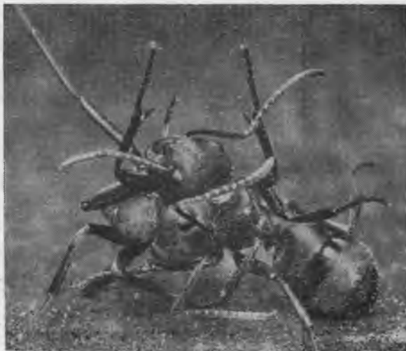
Skruzdžių kovos pasižymi atkaklumu ir žiaurumu

"Kautynių lauke kovėsi keli tūkstančiai skruzdžių, poromis susikibusių savo žiaunomis; kitos bėgiojo jieškodamos viena kitos, puldamos, prievarta vilkdamos viena kitą belaisvėn į savo miestą, kur jų laukdavo žiauriausias likimas. Kovotojos laistė viena kitą nuodais ir susikibę raicėjojosi dulkėse. Tačiau vienos kurios pusės bendrapilietės viena kitą remdavo. Jei bendrame sąmyšyje kuri savoji, per klaidą, užpuldavo savąją, jos tuoj viena kitą atpažindavo ir smūgius pakeisdavo glamonėjimais — paglostymais. Kol abi armijos tuo būdu rodė savo narsumą ir vykdė skerdynes, abiejų miestų civiliniai gyventojai, nereikalingi naikinimo darbui, tęsė savo keliones miško takeliais, vykdydami savo taikų ir naudingą darbą. Tik toj vietoj, kur vyko kova, kariai judėjo į vieną ir į antrą pusę. Naujos skruzdės be paliovos vyko kovon ir be paliovos į gimtąjį miestą grįždavo kovotojai lydėdami belaisvius. Visų šitų įdomių karų metu skruzdės vartodavo laisvą ir drąsą taktiką.