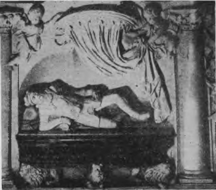
Konstantino Ostrogiškio antkapis Kievo-Pečioros vienuolyne.