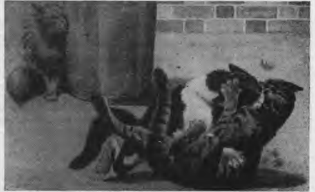
Dvikovė "damos" akivaizdoje

Gyvenimas bendruomenėje gyvuliams teikia aiškų patogumą susijieškant maisto, atliekant lytines