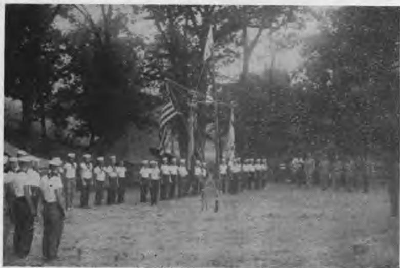
Čikagos "Baltijos Jūros" Tunto "Gintaro Krašto" stovykla

Puikią progą mūsų skautams reklamuoti Lietuvą sudarė didžiuliai jamboree laužai, kuriuos stebėjo