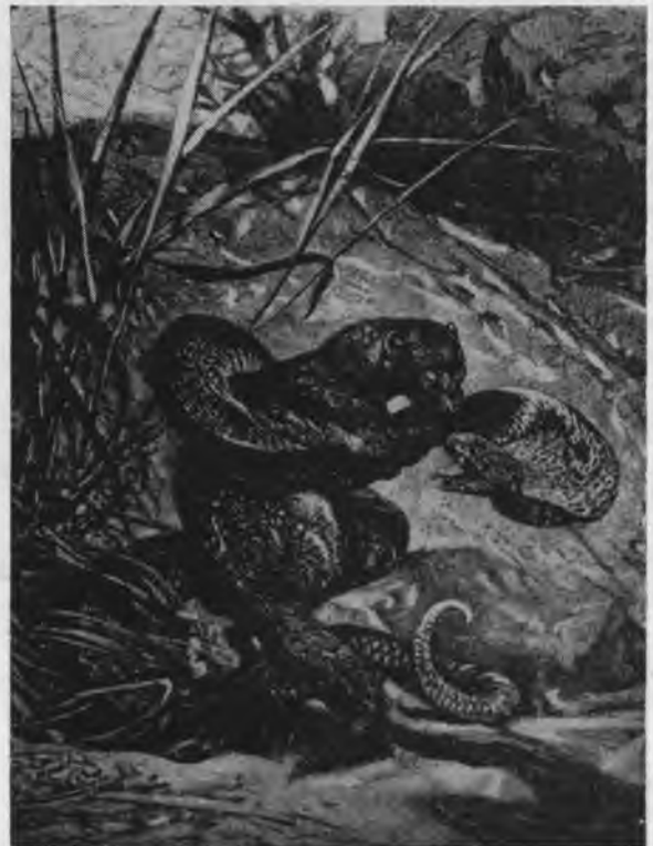
Monguzas ir kobra mirtinoje kovoje

Suaugusiame gyvulyje pasireiškiantis geidimas gali būti patyrimo arba paveldėjimo pasėka. Patyrimo įtaka darosi vis ryškesnė kuo daugiau gyvio rūšis artėja prie žmogaus! Stebėtojai praneša, kad pagrinde daugumos kovų, beždžionių ar vaikų tarpe, glūdi situacijos, sukeliančios varžybas dėl kokio medžiaginio daikto nuosavybės, pavyduliavimo arba savinimosi kokio nors kito individo, paprastai priešingos lyties, arba kai į grupę įsiveržia svetimas, arba kai kas įsikiša ar sutrukdo tuo metu atliekamą kokį veiksmą. Kai kurie antropologai ir psichologai randa tas pat priežastis siekiančias ir suaugusių, pirmųkščių ir civilizuotų žmonių daugumos kovų pačius pagrindus.