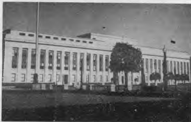
Amerikos Legiono štabas Indianapolyje

Legiono smegenis sudaro apie 12 I D. Karo veteranų, kurie nustatinėja veikimo gaires, parenka vadovybei kandidatus. Jie yra žymūs pramonininkai, teisininkai, bankininkai bei prekybininkai. Legiono vyriausioji vadovybė rekama kas metai, joje yra po lygiai I ir II D. Karo veteranų.