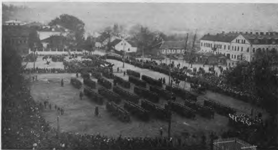
Kariuomenės paradas prie Karo Muzėjaus Kaune 1920 metais Iš H. Bezumavičiaus rinkinio

Tuo tarpu mūsų žinomas karinės spaudos publi-cistas majoras P. Ruseckas savo straipsniuose pa-