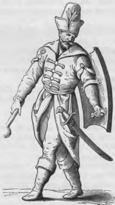
Lietuvos karys viduramžiais

Zbyška pasiliko, bet jo dvasia ir kūnas jau tėsi lyg atgiję. Jam buvo miela mąstyti, kad dar turės tris mėnesius gyventi, kad išvyks į tolimus kraštus, susiras Lichtenšteiną ir susitiks su juo žūtbutinėje kovoje. Jau viena mintis apie tai pripildė jo krūtinę džiaugsmu. Gera yra nors per dvyliką savaitę jausti po savimi arklių, jodinėti po platų pasaulį, kautis ir nežūti be garso. O vėliau — tegu įvyksta, kas nori — juk tai milžiniškas laiko tarpas. Gali karalius grįžti iš Rusijos ir dovanoti bausmę, gali prasidėti karas, apie kurį visi jau nuo seno kalba. O pagaliau gali ir pats kaštelionas, po trijų mėnesių išvydęs Lichtenšteino nugalėtoja, pasakyti: "Skubėk dabar į miškus ir girias!" Zbyška aiškiai jautė, kad niekas, išskyrus kryžiuotį, jo negalėjo nekęsti ir pagaliau net ir pats griežtasis krovietis jį lyg iš prievartos pasmerkė mirti.