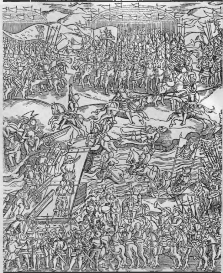
Oršos kautynių pradžia, iš Martyno Bielskio kronikos, išcistos 1597 m.