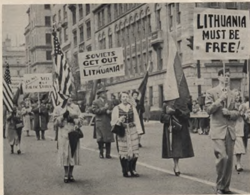
Solidarumo paradas New Yorke 1953 metais. Čia matome lietuvių grupę su dalimi plakatų ir trispalve.

Tai gali būti paneigta, bet JAV Karo Aviacijos vienetai virš Japonijos pastebėjo skraidantį visiškai naują sovietų sprausminį bombonešį JL-28. Atrodo, kad raudonieji bombonešiai tik tada įskrenda į Japonijos teritoriją, kai ten jų radaras nemato amerikiečių patruliuojančių naikintojų. Ir kai tik JAV naikintojai priartėja prie tos erdvės, JL-28 sprunka į šiaurę.