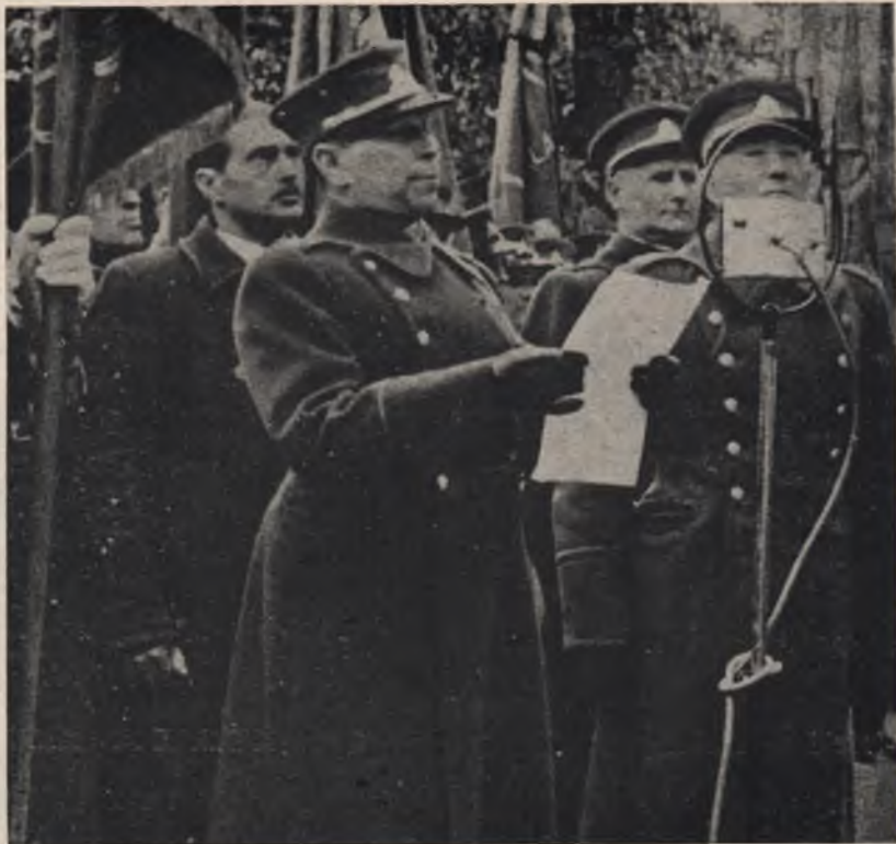
PLK. PR. SALADZIUS,

Atskirai paminėdamas vieną kitą šaulių S-gos šventės programos dalį, noriu duoti progos skaitytojams prisiminti visą eilę šviesių, nuotaikingų mūsų laisvės gyvenimo mo-