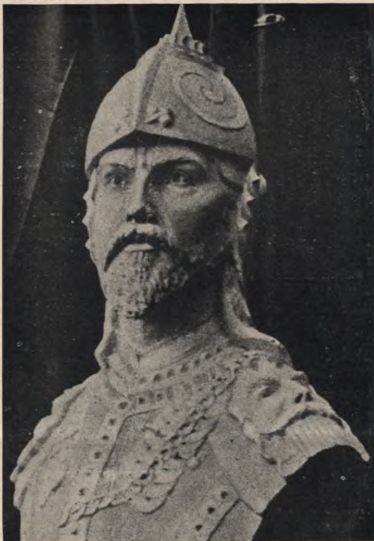
D. L. KUNIGAİKŠTIS GEDIMINAS Padavimas sako, jog jis įkūręs Vilniaus miestą.