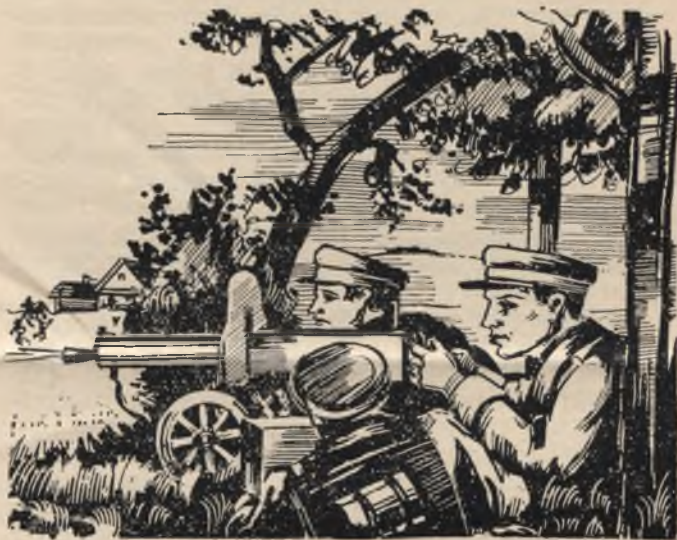
... Iš čia staiga pasipylė kulku serijos...