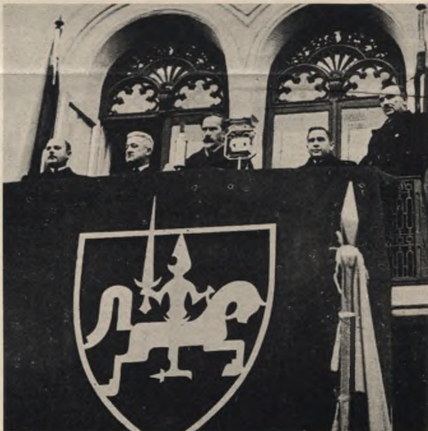
LIETUVOS RESP. PREZIDENTAS A. SMETONA, asistuojant vyriausybės nariams, iš prezidentūros balkono kalba į susirinkusią minią Vilniaus grįžimo iškilmių dieną.