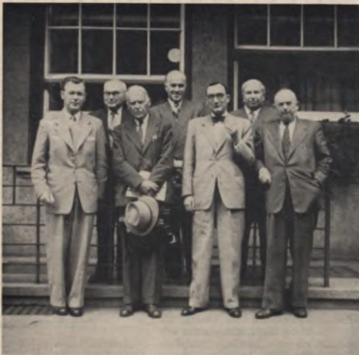
VLIKO ir Lietuvos Diplomatijos atstovai Vakarų Vokietijoje, š. m. rugsėjo 14 d. pasirašius susitarimą, apjungiantį Lietuvos vadavimo darbus

Visi suprantame, kad, gal būt, didesnių tarptautinių įvykių išvakarėse lietuvių kovinių, politinių ir diplomatinų pajėgų vieningumas yra pirmo ir nediskutuotinc būtinumo reikalas. Žinome net, kad to pageidauja ir didžiosios pajėgos, suinteresuotos matyti kuo tampresnį antiblševikinių veiksmų frontą Europoje. Bet mes... su skausmu turėtume prisipažinti, jog dar nepasirodėme tų padėties reikalavimų aukštumoje. Priešingai, mes atskleidėme savo aistras ir silpnumą, parodėme, kad esame tokie pat emigrantai, kaip ir visi, kurie moka tarpusavyje rietis smarkiau, negu praeitį pamiršę ir į vieną aiškų tikslą sužiūrę atkakliai ir solidariai dirbti.