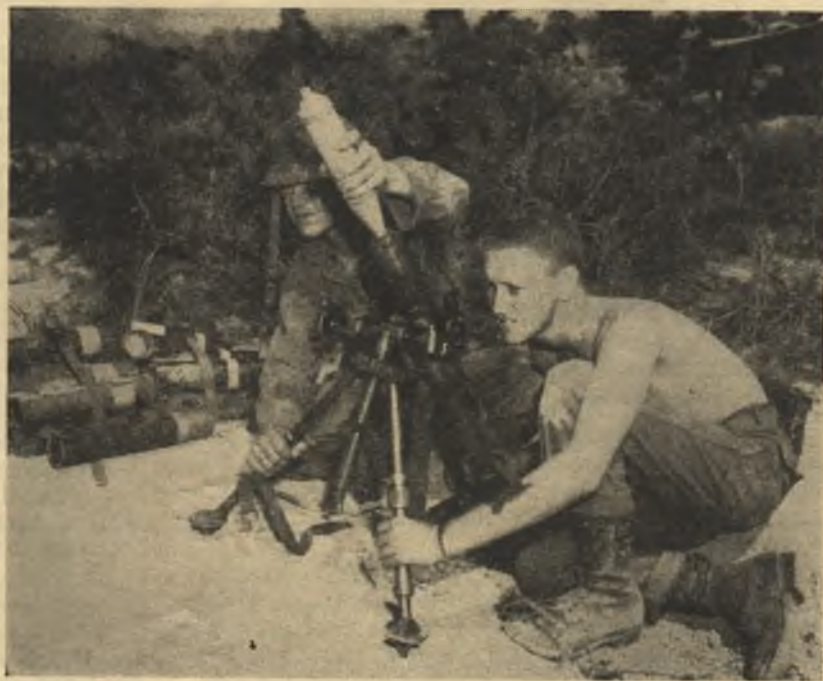
Korejos mūsų laukuose — 60 mm minosvaidis parengtas paleisti ugnį