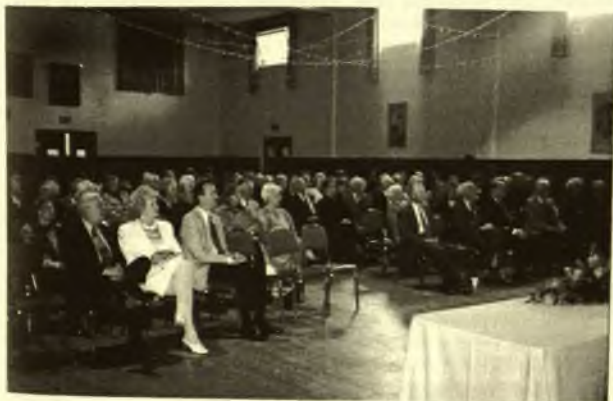
Los Angeles LFB 32-ųjų politinių studijų dalyviai.

Lietuvos užsienio reikalų ministras Algirdas Saudargas skaitė šią paskaitą Los Angeles LFB politinių studijų savaitgalyje, 1999 sausio 31 d.