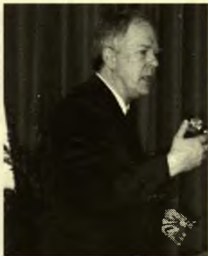
Min. Algirdas Saudargas LFB politinių studijų savaitgalyje skaito paskaitą.

viršūnių ar šiaip ypatingesnę susitikimą. Tuo tarpu tikroji užsienio politikos kasdiena yra pripildyta labai konkrečių dalykų, pradedant importo tarifais ar eksporto kvotomis ir baigiant mūsų piliečių užsienyje bėdomis ar jų pačių susikurtomis problemomis.