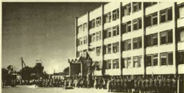
Garliavos Juozo Lukšos gimnazijos rūmai 1994 metų dedikacijos iškilnių metu.