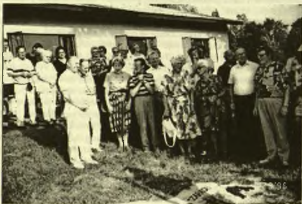
Studijų savaitė Dainavoje. Belaukiant uždaramojo žodžio.

galima ir būtina padaryti. Šie pakeitimai turi būti partijų, kurias mes rem-sime, platformose.