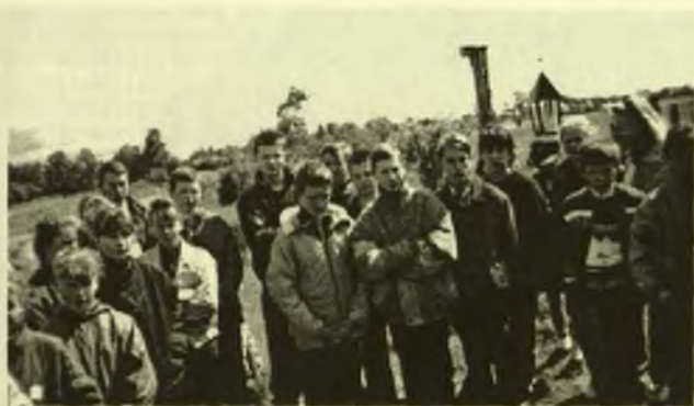
Juozo Lukšos gimnazijos mokiniai lanko partizanų kovų vietas.

meravęs mums „Tėviškės Žiburius“, atsiuntes daug vertingų knygų lietuvių, anglų ir vokiečių kalbomis, įvairių žurnalų, muzikos plokštelių ir kt. Iš JAV reguliariai gauname dienraštį „Draugą“, net nežinome, kas jį užprenumeravo. Gauname ir žurnalą „Į laisvę“. Visiems mūsų geradariams esame nepaprastai dėkingi.