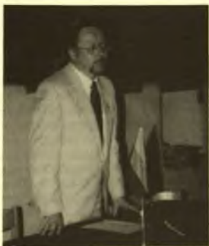
Sąjūdžio tarybos pirm. prof. V. Landsbergis Gotlande.