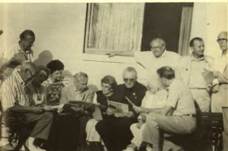
LFB savaitė Dainavoje. Popiečio saulėje, pertraukų metu buvo įdomu pasiskaityti naujausius laikraščius iš Lietuvos.

išsivysčiusia Vakarų kultūra. Ščerbitskis nėra amžinas. Arba mirs, arba bus Gorbačiovo išstumtas. O Ščerbitskio įpėdinis gal jo pilnai nebepakeis, kaip ir Griškevičius ar Songaila pilnai nepaveldėjo Sniečkaus galių. Gorbačiovo reformos, apkarpančios saugumo galią, gal palengva pasieks ir Ukrainą. Rūgimas vyksta ir dabar. Dalis disidentų galėjo grįžti iš Sibiro. Jei Ukraina ir vėluoja, palyginus su Pabaltijū ar su Kaukazu, tai gal tik dešimtmečiu ar net ir mažiau.