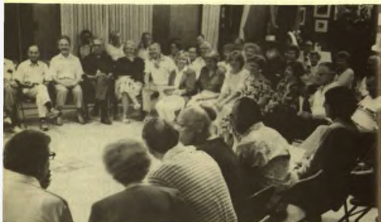
LFB studijų ir poilsio savaitėje saviveiklinė vakaro programa. Nuotr. V. Maželio.

spraudėsi į dabartį kaip neužslopinta tautiškumo viltis, kaip tautos perspektyva. Sąjūdis, pagaliau, tai kentėjimo ugnimi liesti ir pažymėti dabarties intelektualai, sugėrę į save didžiulį kentėjimų kiekį, permąstę skaudžiausią tautos būvį ir šitokio kentėjimo dėka pakilę į ontologinį tautos situacijos bei jos perspektyvų apmąstymą. Tai jie visi drauge, o tuo pačiu kiekvienas skyrium šaukė ir kvietė ateiti Sąjūdį ir tautinį atgimimą. Šia prasme Sąjūdyje atrandame visas „tautos daleles“ — bendro jos kentėjimo skeveldras — tremtinius, išeiviją, valstietiją, resistenciją, pagrindį, Bažnyčią... Išlikdami gyvi ar mirdami, bet perduodami grynėjantį intelektualinį