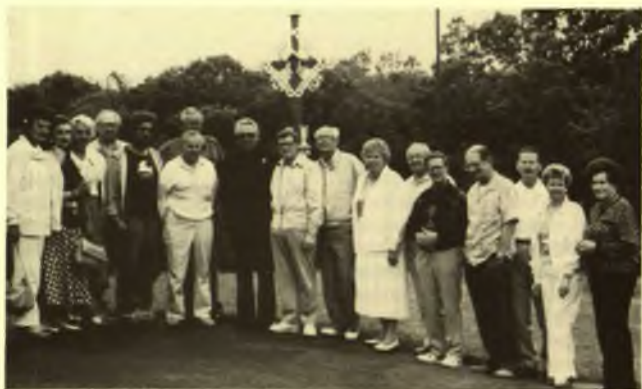
LFB savaitė Dainavoje. Grupelė stovyklautojų su kun. A. Svarinsku prie pakelės kryžiaus.

Karaliaučiaus srityje ar lenkų įsitvirtinimas jų vietoj, todėl kalbėdami su vokiečiais, galime tokiam planui pilnai pritarti. Tačiau iš tikro jis neįvykdomas, nes vokiečiai Pietinių Rytprūsių iš lenkų be karo negaus. Lenkams pasilaikant Pietinius Rytprūsius lieka atviras tik Karaliaučiaus srities klausimas.