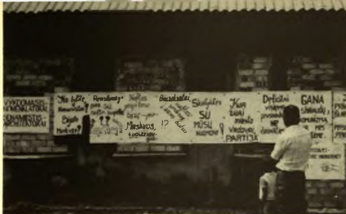
Ant sienų iškabinti plakatai Klaipėdos Demokratijos aikštėje 1989 liepos mėnesį.

Lietuvos komunistų partijos centro komiteto vadovaujantys asmenys.