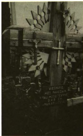
Detalė iš Kryžių kalno Lietuvoje, netoli Meškuičių. 1986 nuotrauka.