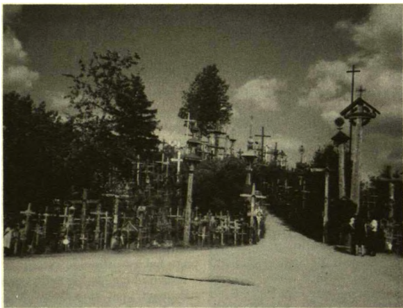
Kryžių kalnas netoli Meškuičių. Nuotrauka daryta 1986.

žodžiai: „Vigilija — tai budėjimas ar laukimas, budėjimas pavergtos tautos naktį, skiriant jai savo darbą, siekiant laisvės pavergtiems“. Ir taip metai iš metų švenčiame vigiliją, ir tikim, ir viliam, kad ta vigilijoje laukiama džiaugsmo šventei Lietuvai greit išauš.