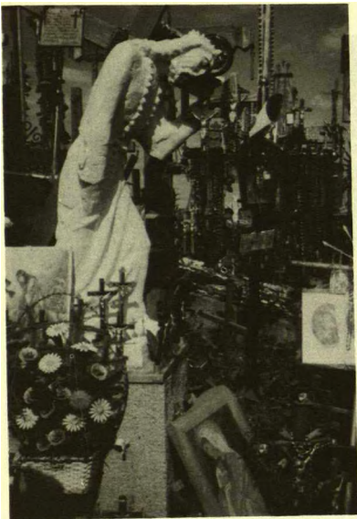
Detal iš Meškuičių Kryžių kalno. 1986 nuotr.

iau atsiverdavo. Ta iau sutikau partie i , kurie be baim s visk r ž , nevyniodami žodži vat . Kartais nustembi žmonė dr sa!