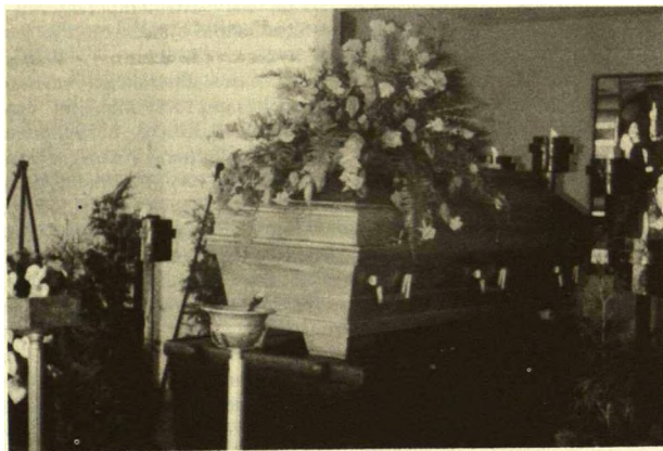
Profesorius Antano Maceinos karstas

Labai anksti pam go spaud ir su ja iki mirties nesiskyr . Dar b damas studentu išvert kelet vengr jaunimo rašytojo Tihamer Totho knygy , vadovavo student ateitinink meno draugijai Šatrijai, 1930-31 redagavo Ateit , buvo populiaraus katalik dienraš io XX Amžius steig jas ir redakcijos narys. Daug raš periodin je spaudoje, ta iau publicistika neužgož jo gilios filosofin s minties, kuri originaliai ir produktyviai reišk si