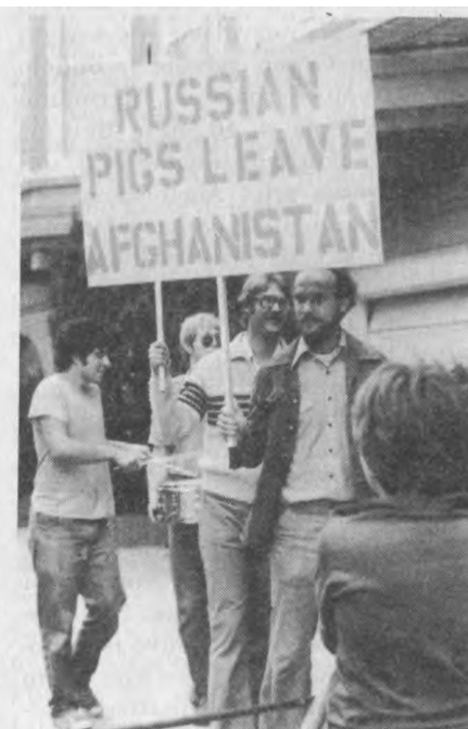
Lietuvi jaunimas už Afganistano laisv , o afganistanie iai už Baltijos valstybi