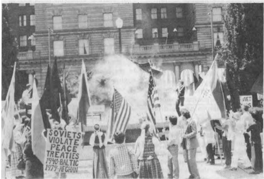
Pro paskleistas užuolaidas iš konsulato pastato raudonieji stebi, kaip raudonose liepsnose pleška raudonoji komunist v liava