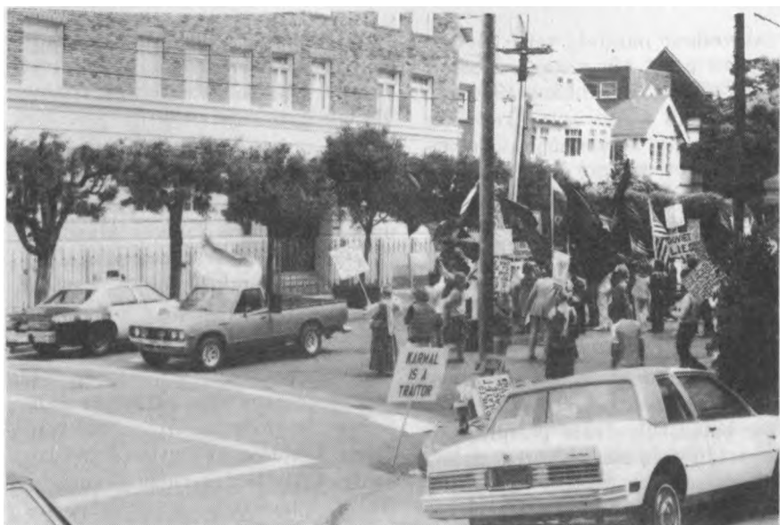
Žmon s, plakatai, v liavos ir policija prie rus konsulato San Francisco mieste.