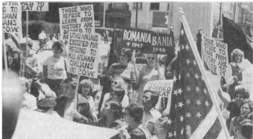
Lietuvi jaunimas visas tautines grupes sutelk kov prieš žmoni ir taut paverg j Rusij