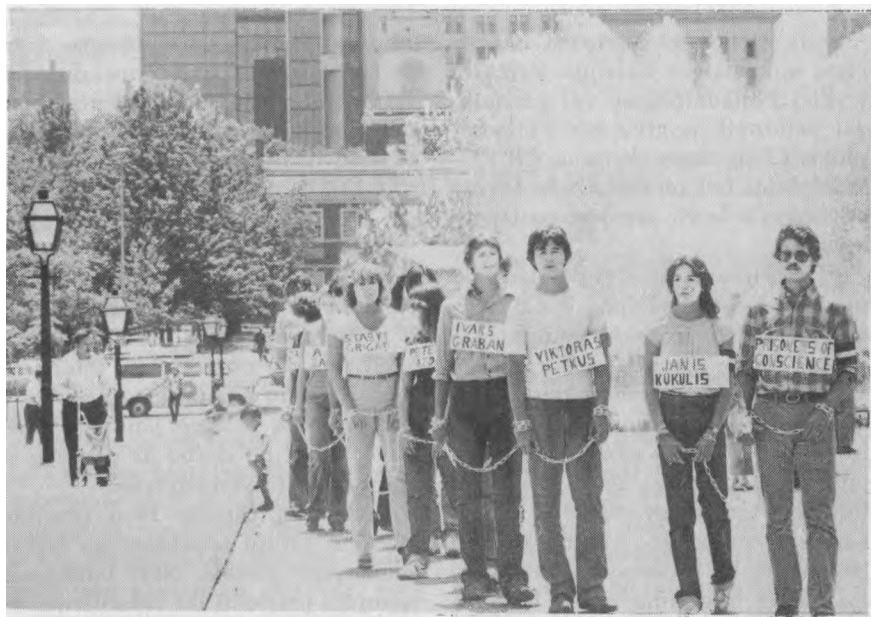
Susirakin Philadelphijos LJS-gos nariai pavaizduoja balt politinius kalinius soviet kal jimuose ir koncentracijos stovyklose