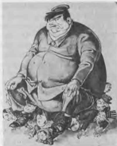
“Koezistencija”, pagal italų laikraštį “Candido”.

Izoliavimasis savo egzistencinių interesų rate kaip koegzistencijos šaknis, pareiga prieš tai kovoti įspėja mus pačius laikytis galimai aukščiau dvasinių interesų ir plataus solidarumo rate.