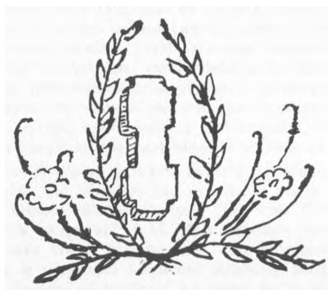
Tauro leidinio užsklanda — paskutinis puslapis.