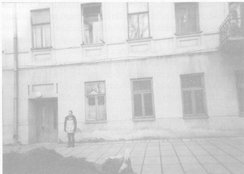
Šiame name, prie Įgulos bažnyčios Kaune, Pranas Žiauberis buvo nuteistas 10 metų katorgos