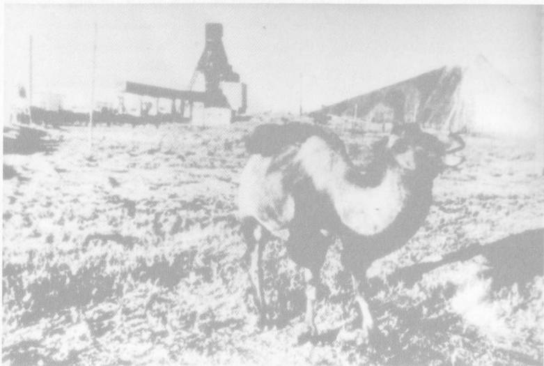
Vario kasyklos Kazachstane, Džezkazgano Rudnikas n/n 392/2