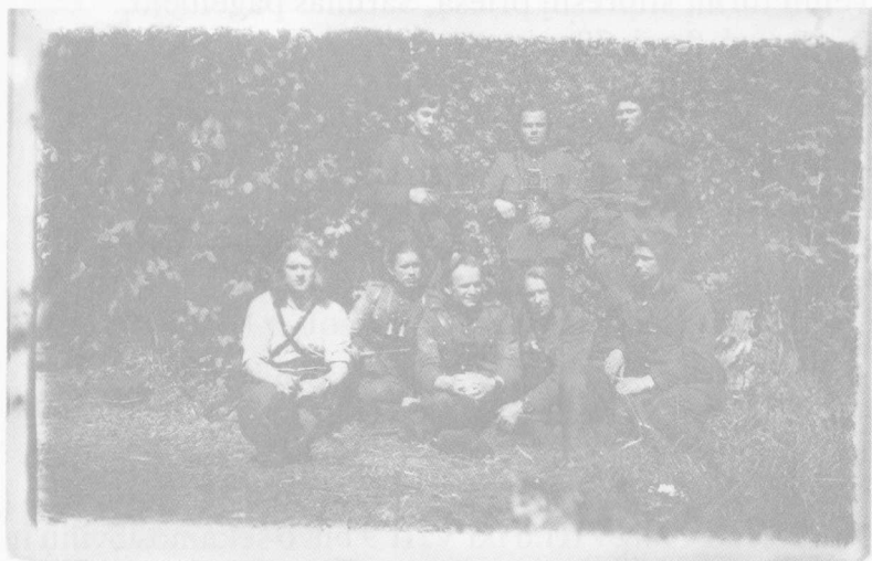
Maironio rinktinės partizanai

Žinios atatinka tikrenybei. Už pasiaukojančią drąsą ir ypatingą orientaciją, nugalėjus savo tiesioginį priešą ir