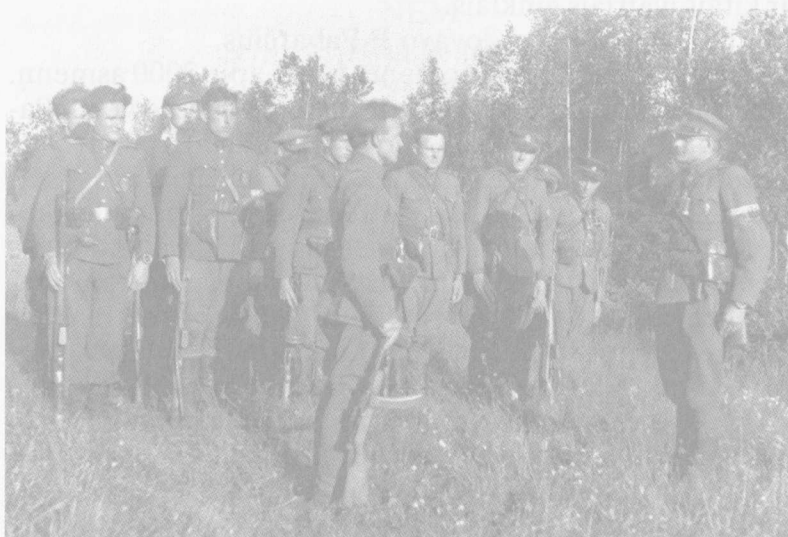
Prisikėlimo apygardos partizanai