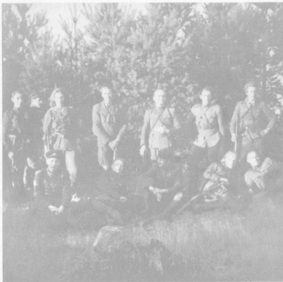
Prisikėlimo apygardos partizanai