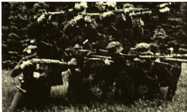
Prisik limo apygardos, Maironio rinktinės partizanai šaudymo pratybose Žaiginio miške. Nuotr. - daryta 1949 spalio mėn.

mintin vaizdas - partizan dainos prie laužo, rytin malda, atsisukus saul . Šilti rytai sudar ramyb s sp d , nors žinojome - ramyb neilgam.