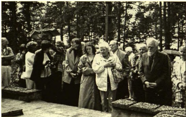
Sotintosios studij savait s dalyviai aplank partizan paminkl Perlojeje.