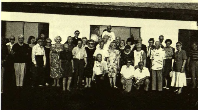
42-rosios LFB studijų savaitės dalyviai Dainavoje prieš nuleidžiant vliavas.

Iš visų „ pilnutinė demokratija " nuostatų pabandykime šiek tiek atidžiau pasvarstyti šiuos esminius nuostatus apie ekonominį lygiavimą. Pasirinktinai naudoju šiuos dabarties Lietuvoje prigijusius, nors ir sovietiniu paveldu kvepiantį terminą. Sovietinės okupacijos metu tai buvo propaguojama, kalama galvą, o vykdoma tik savąjį naudai. Ir atgavus Nepriklausomybę, stengiamasi tų lygiavimą pasiekti. Neužmirškime, kad ir paprasti piliečiai, ir ekonomijos vadovai, o taip pat ir politikai - ne angelai, o žmonės... Ir jie visi, kaip ir šventieji, labai save riesti. Kas tuo noriu pasakyti? Tik tiek, kad reikia pagalvoti ar 1958 metais priimta „ Pilnutinė demokratija " šiuo metu galioja? O gal jau laikas, atsimenant, kad ji buvo priimta Lietuvai dar esant okupuotai, iš naujo pažvelgti dabartines sąlygas ir „ pilnutinė demokratija " pritaikinti ne kaip idealistinį pasisakymą, bet kaip konkrečią politinę ir ekonominę programą.