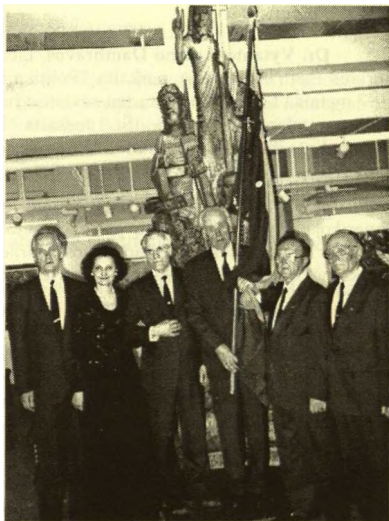
"Giri aidas" koncerto Pasaulio lietuvi centre Lemonte, JAV, 1998 spalio 9 d. atlik jai.