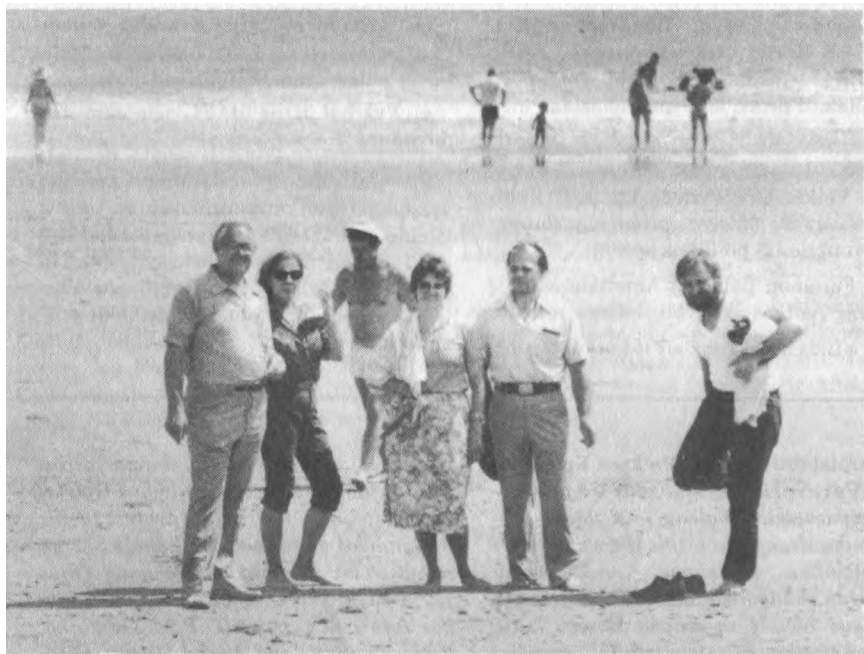
Grįžtant iš Atlanto: J. Ardys, R. Mironienė, R. Ardienė, S. Kudirka, VI. Šakalys