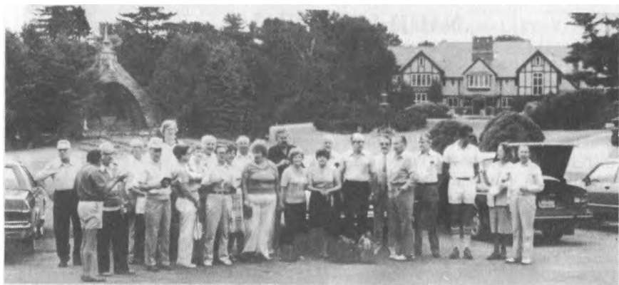
Studijos ir poilsis pasibaig . Prieš akis kelion namo. Sudie Kennebunkportui su Liurdo šventove ir vienuolynu.