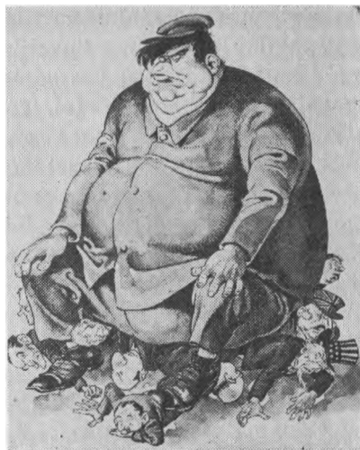
"Koezistencija", pagal ital laikrašt "Candido".

Izoliavimasis savo egzistencini interes rate kaip koegzistencijos šaknis, pareiga prieš tai kovoti sp ja mus pa ius laikytis galimai aukš iau dvasini interes ir plataus solidarumo rate.